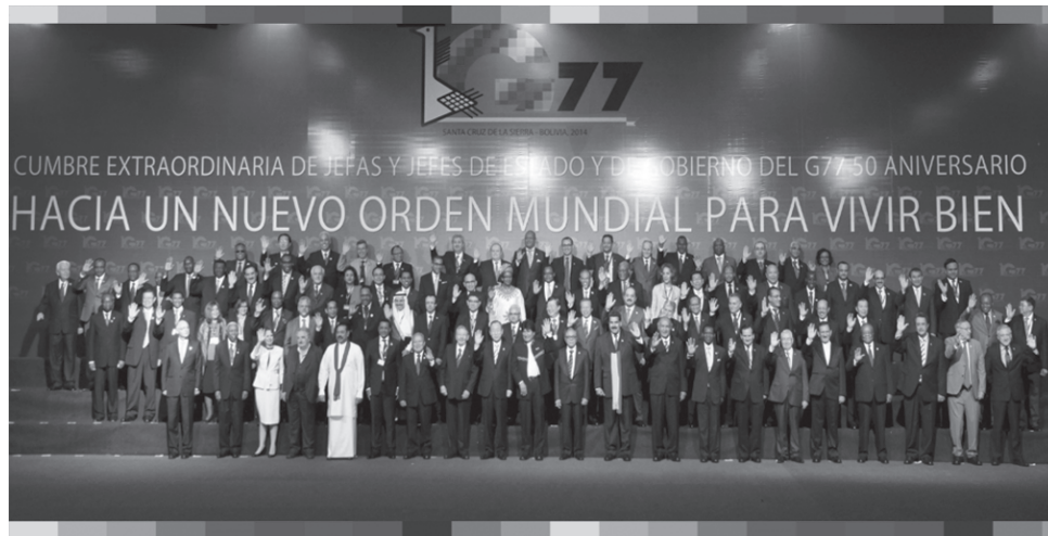
Conmemoración 50 aniversario de creación del organismo multilateral

Evo Morales confirmó que la declaración hace hincapié en el problema de desigualdad, situación que se agrava por patrones de consumo y producción insostenibles en los países desarrollados. El Jefe de Estado boliviano manifestó “La declaración establece que la excesiva orientación al lucro no respeta a la Madre Tierra y preocupa la influencia de grandes empresas que en la economía mundial tiene efectos negativos en el desarrollo”. Aclarando que los principales puntos acordados son: la ratificación de los principios de unidad, complementariedad y solidaridad; la construcción de un nuevo orden mundial que pretende restablecer un sistema más justo y democrático que beneficie a los pueblos. Por su parte, Argentina sugirió que se recalque la necesidad de contar con un sistema de calificación más transparente y se condene el espionaje. Se destacó, la recuperación de los recursos naturales, la consideración de los servicios básicos como derechos humanos y los derechos de la Madre Tierra son otras propuestas de fondo que han sido asumidas por los miembros del G77. Otro concepto incluido en el documento es el del Ama Sua, Ama Llulla, Ama Quella (No seas ladrón, no seas mentiroso, no seas flojo) , como guía de comportamiento ético de los gobiernos. También se reclama la inmediata eliminación de formas subsidiarias de la agricultura y se expresa el compromiso de lograr la igualdad de los derechos de las mujeres. Otros puntos resaltados se encuentran: