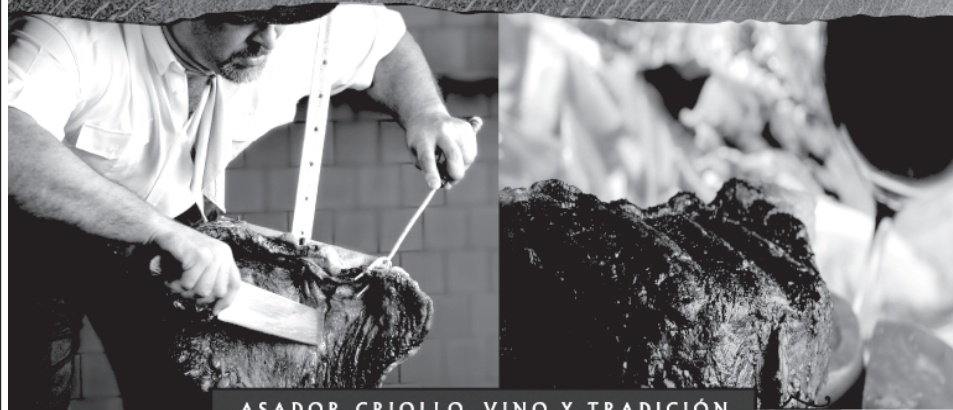
ASADOR CRIOLLO, VINO Y TRADICIÓN